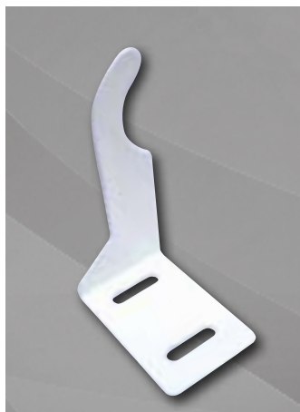
Кронштейн угловой универсальный 95x70mm