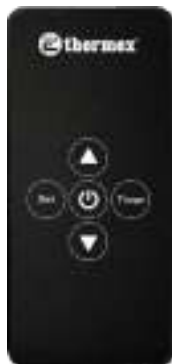
Рисунок 4. Пульт дистанционного управления

Если вы не используете ЭВН в зимний период и существует вероятность замерзания водных магистралей и самого водонагревателя, рекомендуется отключить питание и слить воду из ЭВН во избежание повреждения внутреннего бака.