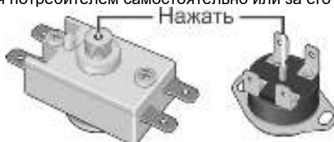
Рисунок 5. Возможные схемы расположения кнопки термовыключателя

Вышеперечисленные неисправности не являются дефектами ЭВН и устраняются потребителем самостоятельно или за его счет.