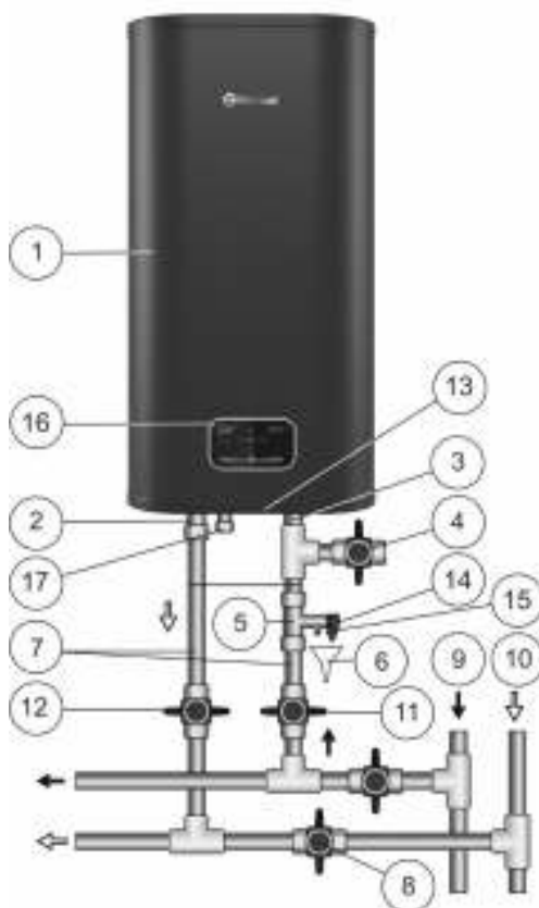
Рисунок 1. Схема подключения ЭВН к водопроводу в вертикальном положении вертикальных моделей V.

Если давление в водопроводе превышает 0,7 МПа, то на входе перед ЭВН необходимо установить редуциционный клапан (не входит в комплект поставки ЭВН) для снижения давления воды до нормы.