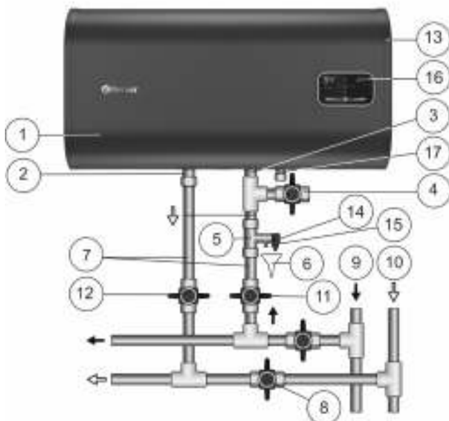
Рисунок 2. Схема подключения ЭВН к водопроводу в горизонтальном положении горизонтальных моделей Н.