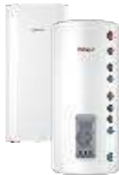
Комбинированные (косвенные) водонагреватели