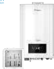
Электрические котлы и комнатные термостаты