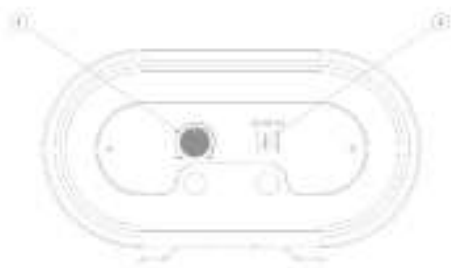
Рисунок 2. Панель управления

Рисунок 2: 1 – регулятор температуры, 2 – клавиши регулировки мощности.