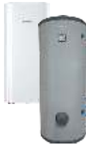
Комбинированные (косвенные) водонагреватели