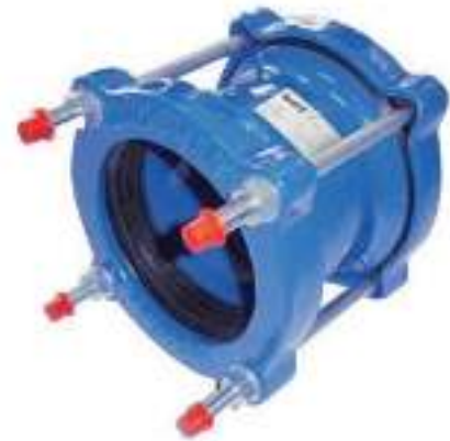
Эпоксидное покрытие RAL 5015, толщина 250 мкм

Герметичное соединение обеспечивается уплотнительным кольцом, которое позволяет надежно обжать два гладких конца трубы без применения фланцевого соединения или сварки.