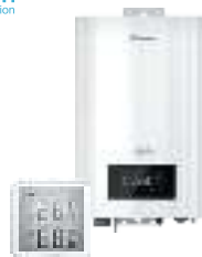
Электрические котлы и комнатные термостаты