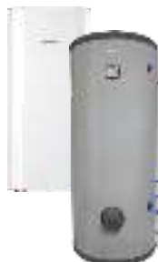
Комбинированные (косвенные) водонагреватели