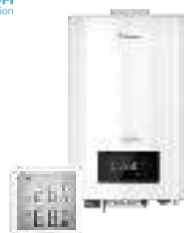
Электрические котлы и комнатные термостаты