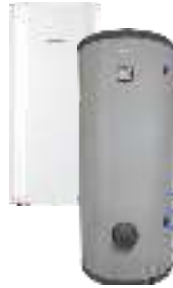
Комбинированные (косвенные) водонагреватели