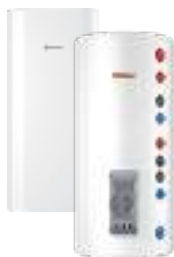
Комбинированные (косвенные) водонагреватели