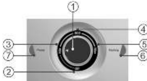
Рисунок 2. Механическая панель управления

Рисунок 2: 1 – ручка управления водонагревателем со стрелкой индикатором, 2 – зона «off» включения/выключения водонагревателя, 3 – зона регулировки температуры «min», 4 – зона регулировки температуры «eco», 5 – зона регулировки температуры «max», 6 – контрольная лампа «Heating», 7 – контрольная лампа «Power».