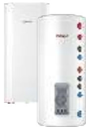
Комбинированные (косвенные) водонагреватели