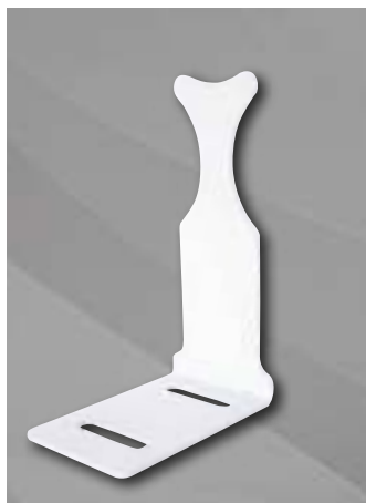
Кронштейн анкерный круглый 9x170mm