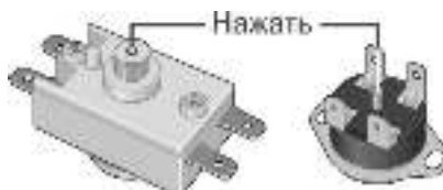
Рисунок 3. Возможные схемы расположения кнопки термовыключателя

Вышеперечисленные неисправности не являются дефектами ЭВН и устраняются потребителем самостоятельно или за его счет.