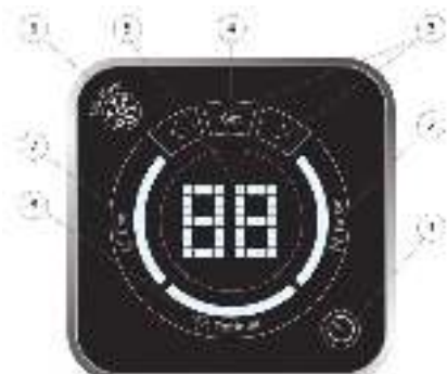
Рисунок 3. Панель управления

При подключении к электросети НЭВН подает однократный звуковой сигнал. Кнопка включения (Рис.3, п.1) мигает. Прибор переходит в режим ожидания. В этом режиме при температуре воды во внутреннем баке ниже 5°C автоматически активируется функция антизамерзания (Рис.3, п.6).