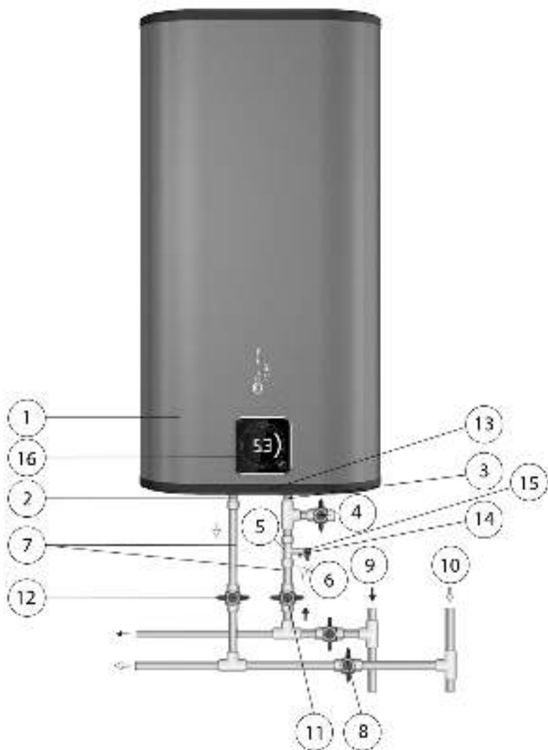
Рисунок 1. Схема подключения ЭВН к водопроводу в вертикальном положении