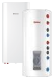
Комбинированные (косвенные) водонагреватели