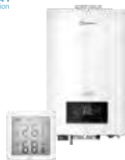
Электрические котлы и комнатные термостаты