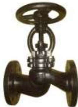
КЛАПАН ЗАПОРНЫЙ ЧУГУН 15КЧ16НЖ РУ25