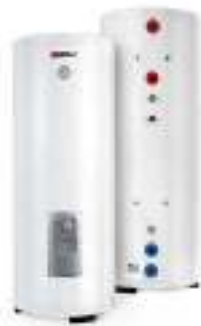
Комбинированные (коч- венные) водонагреватели