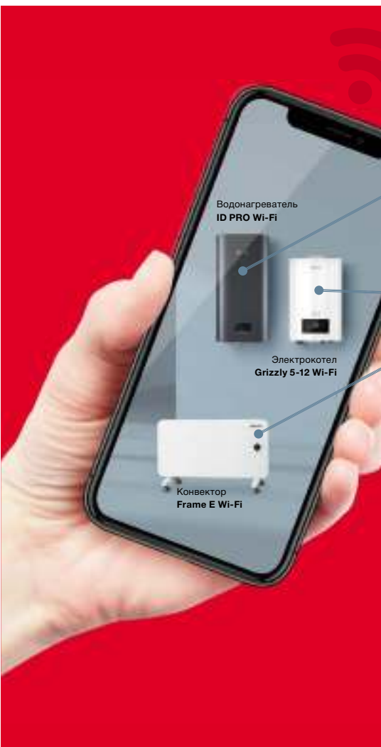
Водонагреватель ID PRO Wi-Fi

Wi-Fi Motion — технология, обеспечивающая стабильную многопользовательскую беспроводную связь с устройствами Thermex. Подключение оборудования, как ясно из названия, происходит по Wi-Fi, что предполагает широту и удобство удаленного управления техникой в квартире, офисе, загородном коттедже или на предприятии из любой точки земного шара.