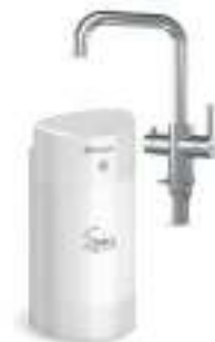
Мультипот система кипячения питьевой воды