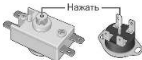
Рисунок 2. Схема расположения кнопки термовыключателя

Вышеперечисленные неисправности не являются дефектами ЭВН и устраняются потребителем самостоятельно или за его счет.