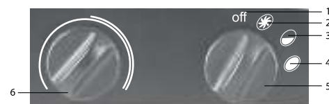
Рис. 2. Блок управления