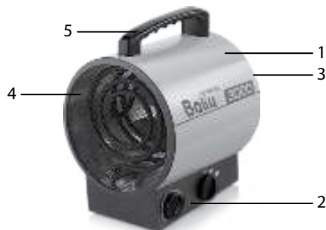
Рис. 1. Устройство прибора

Несущая конструкция тепловентилятора состоит из корпуса, изготовленного из листовой стали и имеющего цилиндрическую форму. В корпусе размещены вентилятор и трубчатые электронагревательные элементы. Снаружи корпуса расположен блок управления. Корпус, закрытый воздухозаборной и воздуховыпускной решетками, винтами устанавливается к корпусу блока управления. Вентилятор затягивает воздух через отверстия воздухозаборной решетки. Воздушный поток, втянутый вентилятором в корпус, проходя между петлями трубчатых электронагревательных элементов, нагревается и подается в помещение через отверстия воздуховыпускной решетки.