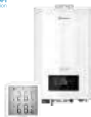
Электрические котлы и комнатные термостаты