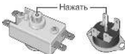
Рисунок 2. Схема расположения кнопки термовыключателя

Вышеперечисленные неисправности не являются дефектами ЭВН и устраняются потребителем самостоятельно или за его счет.