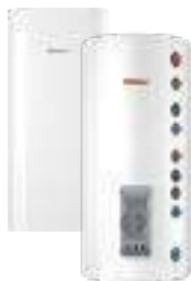
Комбинированные (косвенные) водонагреватели