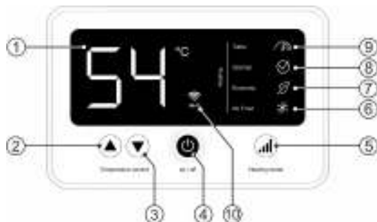
Рисунок 2. Электронная панель управления