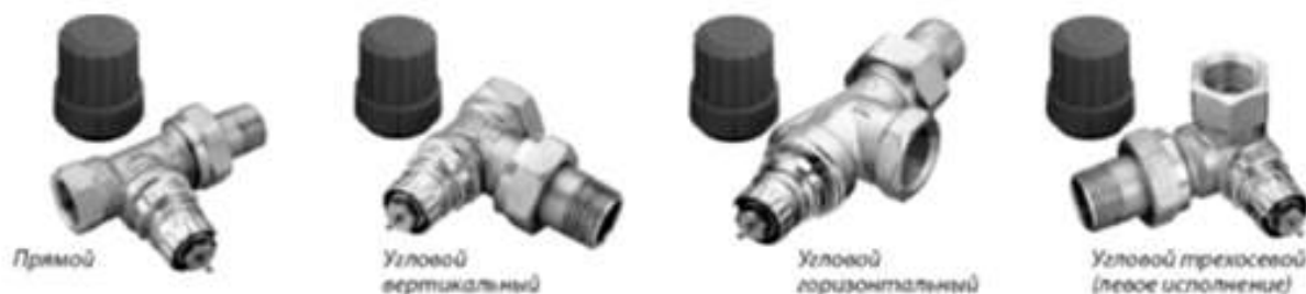
Рисунок - Клапаны терморегулирующие типа RTR-N

Клапаны терморегулирующие типа RTR-N предназначены для применения в двухтрубных насосных системах водяного отопления. Не предназначены для контакта с питьевой водой в системах хозяйственно-питьевого водоснабжения. Клапаны терморегулирующие типа RTR-N оснащены встроенным устройством для предварительной (монтажной) настройки его пропускной способности в рамках следующих диапазонов: