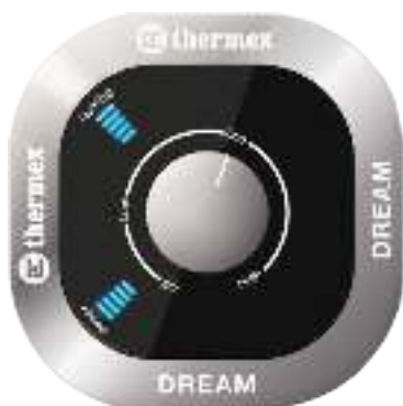
Рисунок 2. Панель управления

Рисунок 2: механический регулятор температуры в центре панели управления с отметками: Off – выключение нагрева, Low – нагрев на низкой температуре, Eco – оптимальная температура нагрева, High – максимальная температура нагрева. Индикаторы: Power – отображение мощности, Heating – индикация хода нагрева.