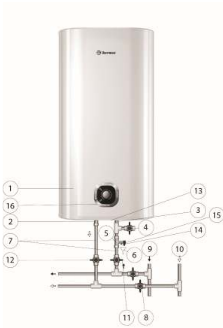
Рисунок 1. Схема подключения ЭВН к водопроводу

Подключение к водопроводной системе производится в соответствии с Рис. 1 только при помощи медных, металлопластиковых или пластиковых труб, а также специальной гибкой сантехподводки. Запрещается использовать гибкую подводку бывшую ранее в употреблении. Рекомендуется подавать воду в ЭВН через фильтр-грязевик, установленный на магистрали холодной воды (не входит в комплект поставки).