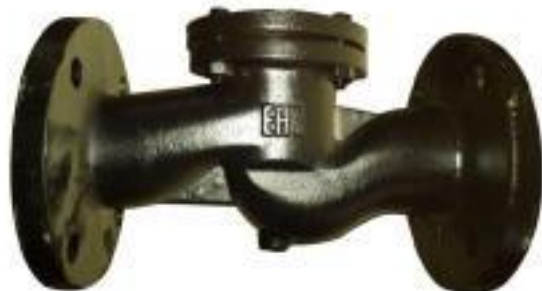
КЛАПАН ОБРАТНЫЙ ПОДЪЁМНЫЙ ЧУГУННЫЙ 16к49нж