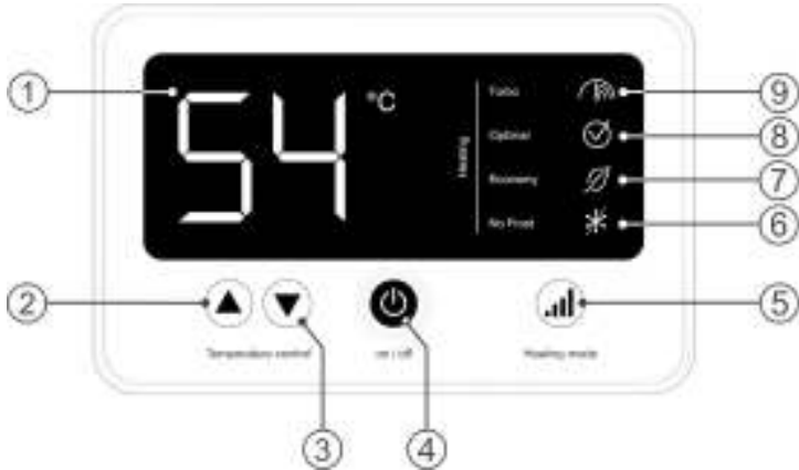
Рисунок 2. Электронная панель управления

Рисунок 2: 1 – LCD дисплей, 2 – кнопка «▲» Temperature control / увеличение температуры нагрева, 3 – кнопка «▼» Temperature control / уменьшение температуры нагрева, 4 – кнопка «on/off» / вкл./выкл., 5 – кнопка «Heating mode» / установка мощности нагрева, 6 – индикация «No Frost» / режим антизамерзания, 7 – индикация «Economy» / Минимальная мощность, 8 – индикация «Optimal» / стандартная мощность, 9 – индикация «Turbo» / максимальная мощность.