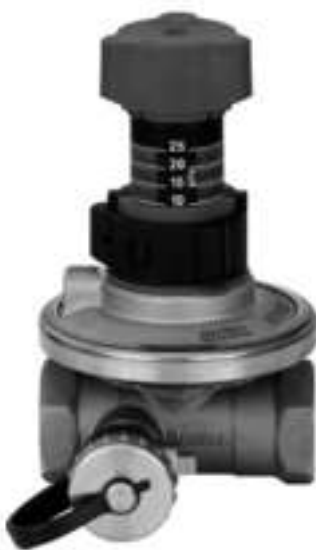
АРТ DN 15-50